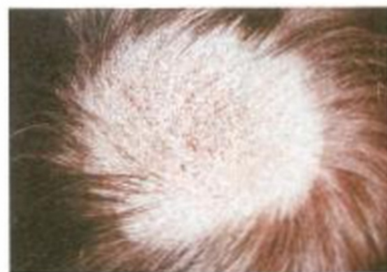
Рис. 6. Микроспория волосистой части головы, очаговое облысение