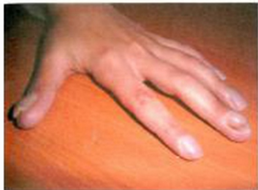
Рис. 7. Хронический кандидоз кожи и слизистых оболочек. Поражение кожи и ногтей кисти