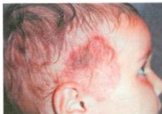
Рис. 4. Микроспория кожи височной области