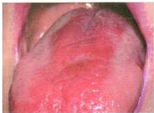
Рис. 9. Кандидоз языка