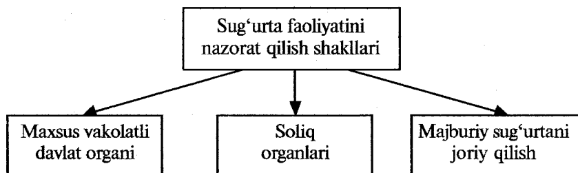
1-chizma. Sug'urta faoliyatini nazorat qilish shakllari.

Masalan, Buyuk Britaniyada sug'urta ishini Savdo va sanoat departamenti, Yaponiyada Moliya vazirligining sug'urta bo'limi, AQSHda esa maxsus sug'urta komissariatlari nazorat qilib boradi. Davlat, bunday nazorat ishini olib borar ekan, avvalo, mam-