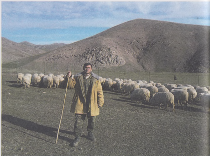
15- расм. Қўйларни кеч куз ва қиш ойларида яйловларда озиқлантириш

- катта яйловларда ўтлатишда яйловнинг бир томонидан бошлаб, кенглиги 150-200 метр бўлган ҳудудни охиригача бир четдан ўтлатиш керак;