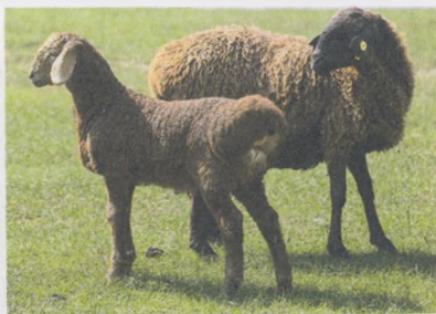
10-расм. Қоракўл ва ҳисор зотли совлиқлар қўзичоқлари билан

Чорвачилик ва паррандачилик илмий-тадқиқот институти Оҳангарон бўлимида ишлаб чиқилган тавсияларга асосан республикамизнинг тоғ ва тоғолди ҳудудларида гўшт-ёғ йўналишидаги думбали қўй зотларида қўзиларни боқишнинг қуйидаги усуллари мавжуд: омихта ем билан қўзиларни боқиш 1 ойлик ёшидан бошланади, бунда икки хил йўл бор: