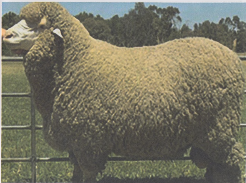
33-расм. Волгоград зотли қўчқорлар

Волгоград меринос зотли қўйлар 1932-1978 йилларда Россияда яратилган. Бу зот қўйлар ўзининг гўшт тузилиш хили билан ажралиб туради.