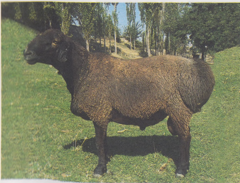
1-Рисм. "Ақчасой" типига мансуб насли қўчқор

Селекция иши бу танлаш демакдир, агарда бирламчи зоотехния ҳисоботлари юритиб, ҳар йили қўчқор ва совлиқларнинг хўжалик фойдали (селекция) белгилари бўйича наслилик қийматларини аниқлаб, мажмуа белгилари бўйича баҳолаб, классларга ажратиб, танлаш ишларини олиб бориш ва такомиллаштириш ҳамда мазкур қўйларнинг янги тип ва зотларини яратиш наслчилик ишининг асосий вазифаларидан биридир.