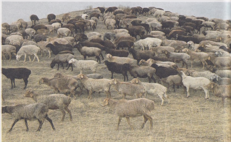
18- расм. Бўғоз она қўйларни қишки яйловда озиқлантириш

ривожланиши натижасида кўп миқдорда сут ишлаб чиқаришига шароит яратлади. Яхши озуқа эгиз туғадиган совлиқлар учун жуда муҳимдир. Ҳомиладорликнинг сўнгги даврида 50-60 кг тирик вазни она қўйга бир кунда 1,0 кг сифатли пича ва 1 кг аралаш озуқалар берилади.