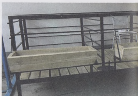
22- расм. Ҳар хил ўлчамдаги охурлар

Охурларни ясашда ёғоч, бетон, тунукалар ва темир қувурлардан фойдаланиш мумкин. Охурлар қўйлар осонгина озиқланишига имкон берадиган тарзда бўлиши керак.