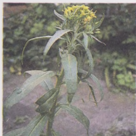
Левкойли сариқ ўти