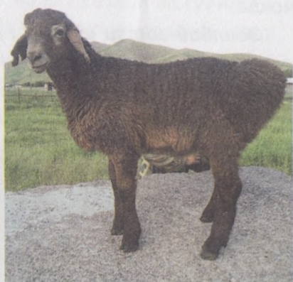
30- расм. Ҳисор зотли қўчқор ва ҳисор зотли қўчқорча

Қўчқорларининг тирик вазни ўртача 130-140 кг, маҳсулдор рекордчилари 170-188 кг, совлиқлар 80-85 кг, айримлари 90-95 кг қўйларнинг думбасидаги ёғнинг оғирлиги 18-20 кг, сўқимга боқилганлари эса 30 кг тош босади. 1,5 яшар қўчқор-