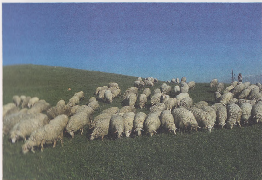
3-расм. Яриммайин жун берувчи гўштдор-сержун қўйлар

6. Танлашда қўйларнинг маҳсулдорлиги (тирик вазни,