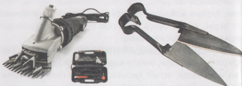
12-расм. Жун қирқиш учун электр машинка ва қайчи

Қўйлар қирқлик қайчи билан қирқилганда қўйларнинг танаси жундан тўлиқ тозаланмайди, жуннинг бир қисми қўйларда қолади, қўй терисини кесиш даражаси машинка ёрдамида қирқишдан юқори бўлади. Малакали қирқувчи қайчи ёрдамида бир кунда ўртача 60-70 бош қўйнинг жунини олиш мумкин.