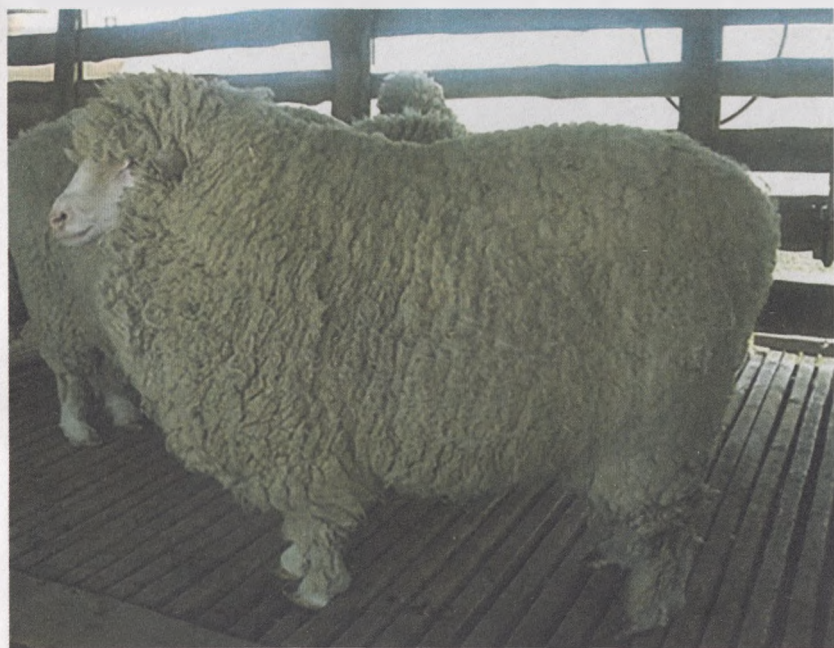
34-расм. Шимолийкавказ гўштдор-сержун зотли қўқор

Ёш қўзилар тез ўсиб етилувчандир (кунлик 250-350 г вазн), гўшт сифати яхши, думбасиз, ёғни тери остида яъни танасида тўплаганлигидан мармарсимон гўшт беради ҳамда гўшти бўш, мазали, сувли, майинлиги билан ажралиб туради.