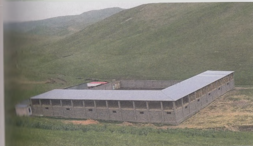
20- расм. Қўйхона биносининг умумий кўриниши.

Тук ёшдаги бир бош қўй йилига 750-800 кг гўнг чиқаради.