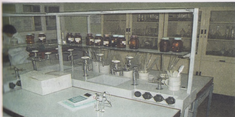
24- расм. Дори-дармонлар учун лаборатория

(тоғоч қипиғи, сомон) ишлатилса, ифлосланган тўшамаларни ёт бошланиши олдидан (туғиш бошланмасдан) тозалаш керак. Оғилхона деворини, пол ва шифтни оҳақ қилиш лозим. Тоғочли жой (охурлар ва катаklarни) металл қисмлари бўялиши, ферма тўлиқ дезинфекция қилиниши шарт.