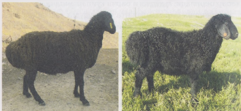
27- расм. Жайдари зотли она қўй ва қўчқорча

Совлиқларнинг ўртача тирик вазни 55-60 кг, сермахсуллари 70-80 кг, жун қирқими 2,0-2,5 кг, етук ёшдаги қўчқорларники 80-90 кг, маҳсулдор қўчқорлар 100-130 кг, жун қирқими эса 2,8-3,0 кг ташкил этади. Қўчқорларнинг яғри баландлиги ўртача 76,3 см, гавдасининг қия узунлиги 80,8 см, кўкрак айланаси 96,2 см ни ташкил этади. Бу қўйлар йирик