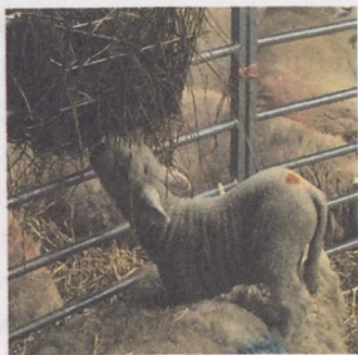
8-расм. Янги туғилган кўзичокларни парваришлаш

Байзи ҳолларда, совлиқ (жуда ориқ бўлганлигидан ёки сомизлиги меъёрда бўлса ҳам) боласини елинига яқин йўлатмайди. Бундай кўзилар қатори онаси ўлган ёки эгизак бўлиб туғилган кўзиларни (агар онаси эгизакларни боқа олмаса) бошқа янги туққан кўйларга ўргатиш керак бўлади. Бу ачинарли ҳолат. Шу боис муаммога ҳолат қолдирмаслик учун кўйидаги тадбирларни қўлланг: