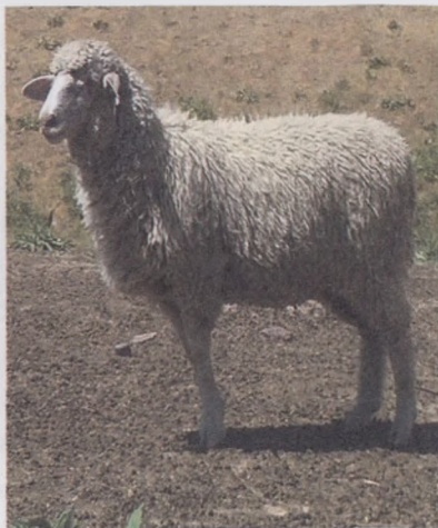
29-расм. 2 яшар гўшtdор-сержун она қўй ва қўчқорча