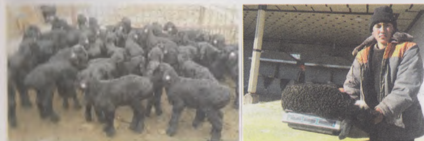
5- Расм. Қиш даврида туғилган қўзичоқлар

Бу даврда қўзилатишнинг ижобий томонлари билан бирга, салбий томонлари ҳам бор, яъни қўшимча харажатлар - бўғоз ва янги туққан совлиқлар учун омихта емлар, сифатли пичан, туғдириш учун иссиқ бинолар ҳамда қўшимча ишчи кучи ва бошқа харажатлар талаб қилинади.