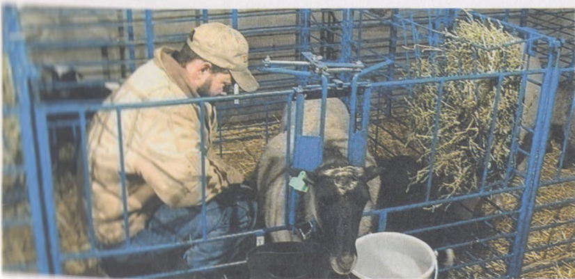
Рисм. Бўғоз қўйларга туғиш пайтида ёрдам бериш

Туғиш мавсумида бўғоз она қўйларни асраш шароитларига алоҳида эътибор бериш лозим. Бўғоз қўйларни туғишга 1-3 кун қолганда уларни елини катталашади, жинсий аъзолари қизариб, чўзилади, сағриси осилади. Туғишдан олдин она қўй безовталанди, қорин қисмини ялайди, тез-тез ўтиб туради, бемалол жой излайди, агарда бўғоз совлиқни озиқлантириш ва асраш шароитлари тўғри бажарилган бўлса, туғиш жараёни яхши ўтади. Жинсий аъзода йўлдоши кўришиб, ҳомила чиққунча бўлган вақт 30-40 дақиқа, биринчи марта туғаётган қўйларда бу жараён 50 дақиқа бўлса, ўз вақтида туққан хисобланади. Агарда юқорида кўрсатилган вақтдан 10-15 дақиқа ўтиб кетса, она қўйга ёрдам кўрсатиш лозим. Она қўй туққандан 1,5 соат ўтгандан кейин йўлдоши тушади, агарда 5-6 соатдан ўтиб кетса, ветеринарни ёрдамга чақиринг. Туғруқ ниҳоясига етгач ёки туғруқ пайтида киндик ўз узидан узилиб кетади, қўйларнинг йўлдоши чиқиб кетиш вақти 0,5-3 соат. Йўлдош тушгандан сўнг бачадон ўз ҳолига кела бошлайди, қўйларда ушбу муддат 30 кун давом этади. Йўлдош тушгач, уни кўмиб ташлаш керак, баъзан она қўйлар ўз йўлдошини ейиши мумкин.