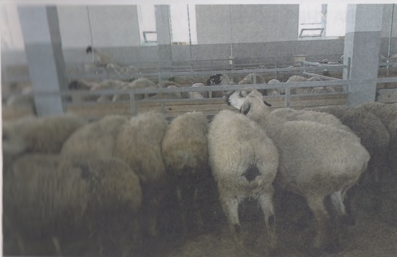
11-расм. Ёшқ қўзиларни катакларда (бўлмаларда) боқиш