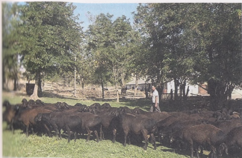
17- расм. Наслли кўчқорларни қочириш мавсумига тайёрлаш

Уруғлантириш даврида озиқлантириш таминан 4-6 ҳафта давом этади. Бу давр мобайнида ҳар бир она кўйга бериладиган кунлик ем-хашак миқдори 1,5 кг пичан ва 250-300 г омукта емни ташкил этиши мақсадга мувофиқдир. Бу қочириш мавсумида яйловларда ўтлаётган бўлса, қўшимча қуруқ ўт бериш шарт эмас, фақатгина аралаш ем берилади.