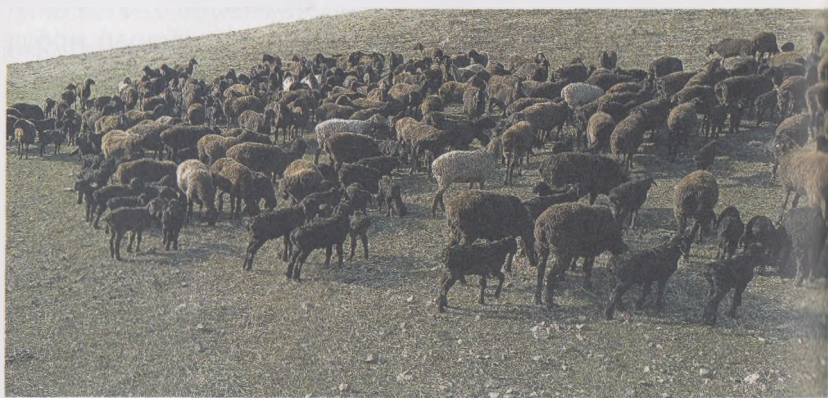
6- расм. Қиш ойларида туғилган қўзилар онаси билан

Илмий ва амалий тажрибалардан келиб чиқиб, шуни тавсия қиламизки, совлиқларни қўзилатиш февраль ойидан бошлаб, март ойининг ўрталарида тугатиш энг мақбул давр ҳисобланади. Бу даврни кеч қишки ва эрта баҳорги туғдириш даври деб юритилади. Бунинг учун қочириш мавсумини сентябрь ва октябрь ойларида ўтказиш мақсадга мувофиқдир. Бу даврда она қўйларнинг пушторлик хусусиятлари 20–25 % га ортиб, улардан ишлаб чиқаришга яроқли соғлом қўзилар туғилади.