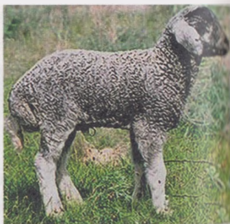
28-расм. Қорақўл зотли совликлар ва қўзилар

Ўзбекистонда қорақўл зотли қўйларнинг рангига кўра қора, сур, кўк зот типлари мавжуд. Буларнинг ичида сур зот типлари жуда сифатли бўлиб, юқори қадрланади. Бу сурлар Қорақалпоқ, Бухоро ва Сурхондарё зот типларидир. Бундан ташқари қорақўл зотли қўйларнинг морфологик, физиологик, маҳсулдорлик ва бошқа наслчилик заводи подасига ҳос бўлган ва хўжалик фойдали белгилари наслдан-наслга ўзгармай ўтадиган 30 га яқин завод типлари яратилган.