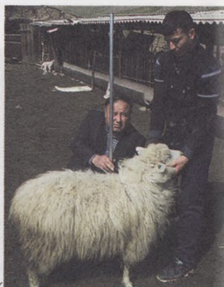
2-расм. Қўйчиликда бонитировка тадбирлари

- насли қўзи олиш учун совлиқларни танлаётганда танланаётган совлиқларнинг онаси кўпинча экиз туққан қўйлардан бўлишига эътибор бериш;