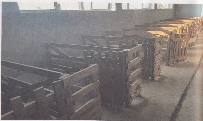
23- расм. Қўзичоқлар учун профилакториялар

100 бош урғочи қўй учун камида 10 та туғруқхона талаб қилинади. Туғруқхонанинг ўлчамлари 1,2x1,2 м, 1,2x1,5 м бўлиши мумкин. Қўйхона (оғилхона) ичидаги яна бир муҳим бўлма сақман бўлмасидир. Ундан ташқари, бўғоз қўйлар, қисир қўйлар, қўчқорлар ва касал қўйлар учун кўчма тўсиқлар билан алоҳида бўлимларга ажратиш мумкин.