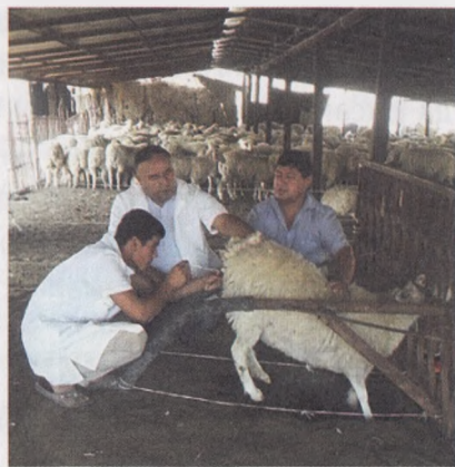
Дорсер. Тўшндор-сержун қўйларда сунъий уруғлантириш амалиёти

Илгари республикамызга хориждан зотдор қўчқорларнинг музлатилган уруғи келтирилиб, совлиқлар сунъий уруғлантирилмаган эди.