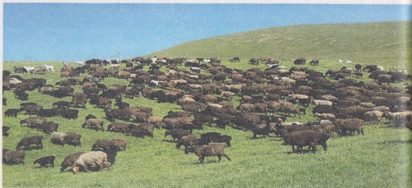
16- расм. Баҳор фаслида тоғолди яйловларда қўй сурувлари

юқори даражага кўтариш, қочириш муддатларини қисқартириш мақсадида (уруғлантириш мавсумидан олдин ва мавсум давомида) озиқлантириш, уруғлантириш мавсумида озиқлантириш, деб аталади.