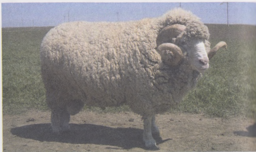
32-расм. Совет меринос зотли қўй

Совет меринос қўй зоти майин жунли жундор-гўштор қўй зотлари гуруҳига киради. Бу зот қўйлари 1926-1951 йилларда кўп зотларни ўзаро мураккаб чатиштириш асосида Россияда яратилган.