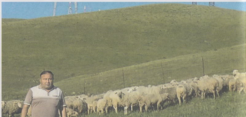
14- расм. Эрта баҳорда қўйларни яйловларда озиқлантириш

- ўтлоқ яйловларга боришдан аввал қўйлар кўрикда ўтказилади, ўсган туёқлар, тирноқлар кесилади. Касалланган, заиф бўлган қўйлар соғлом қўйлардан ажратилади. Улар катта қўйлар (4 ёшдан катта қўйлар), тўқли (1 ёшдан қўзилар) ва қўзичоқларга ажратилади ва вазиятга қараб бир муддат ёзги оғилхоналарда сақланади;