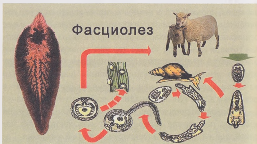
25-расм. Фасциолезларнинг юқиш манбалари