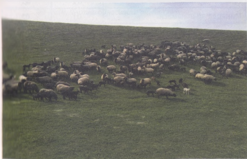
19- расм. Қўкламда қорақўл зотли қўйлар чўл яйловларида

Совликлар сут маҳсулдорлигига кўра, гуруҳларга бўли- нади. Ишлаб чиқариладиган ҳар бир литр сут учун 400-600 г ералаш озуқа ҳамда қуруқ пичан берилади.