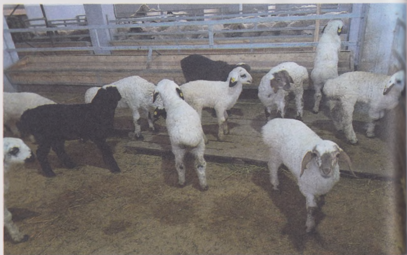
21- расм. Тахта ва ярим бетон полли бўлмалар

баланд бўлиши лозим. Шунингдек, қўра поли олд тарафга қараб 5 фоизлик қия қилиб тўшалишини тавсия этамиз.