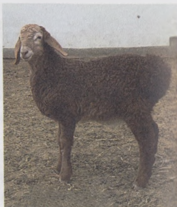
31- расм. Эдилбай зотли она қўй ва қўчқорча