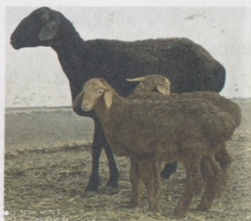
9-расм. Гўштдор-сержун ва эдилбой зотли совлиқлар қўзичоқлари билан

Эрта сутдан ажратиш деганда қўзиларни одатий эмиш давридан аввал сутдан ажратиш тушунилади. Бу усул икки мақсадда амалга оширилади: биринчидан, бир йилда