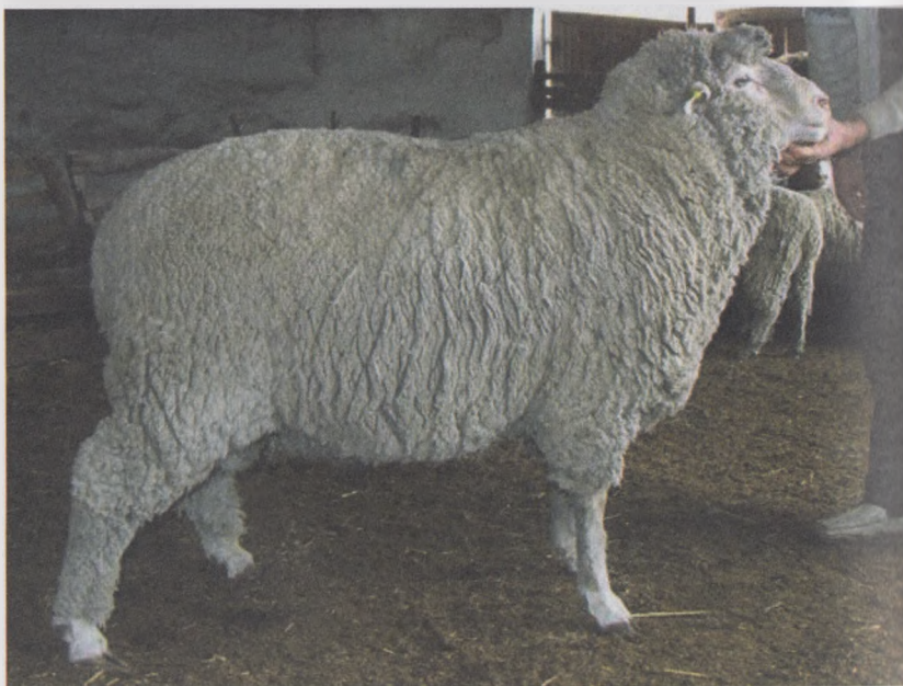
35-расм. Совет гўштдор-сержун зотли қўчқор

Жун маҳсулдорлиги юқори, қўчқорларда қирқилгандан кейин жун миқдори 10,0-14,0 кг, совлиқлариники 5,0-6,0 кг ни ташкил этади ва ювилганда соф жун чиқими 60-65 фоизга тенг, жуни бир хил текис, қалин, чўзилувчанлиги яхши, жун узунлиги 11-13 см, ингичкалиги 27-37 мкм, 56-58 сифатга эга.