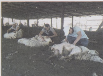
13-расм. Қўйларни махсус қайчилар билан қирқиш