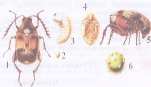
Хитой донхўри: 1- Қўнғизи. 2- Тухуми. 3- Личинкаси. 4- Ғумбаги. 5- Қўнғизининг ён томондан кўриниши. 6- Дуккакли экин уруғидаги тухумлари.

Имагоси қизғиш-жигар ранг, қисқа овалсимон, деярли тўғри бурчакли, узунлиги 2,5 мм, эни 1,6 мм.