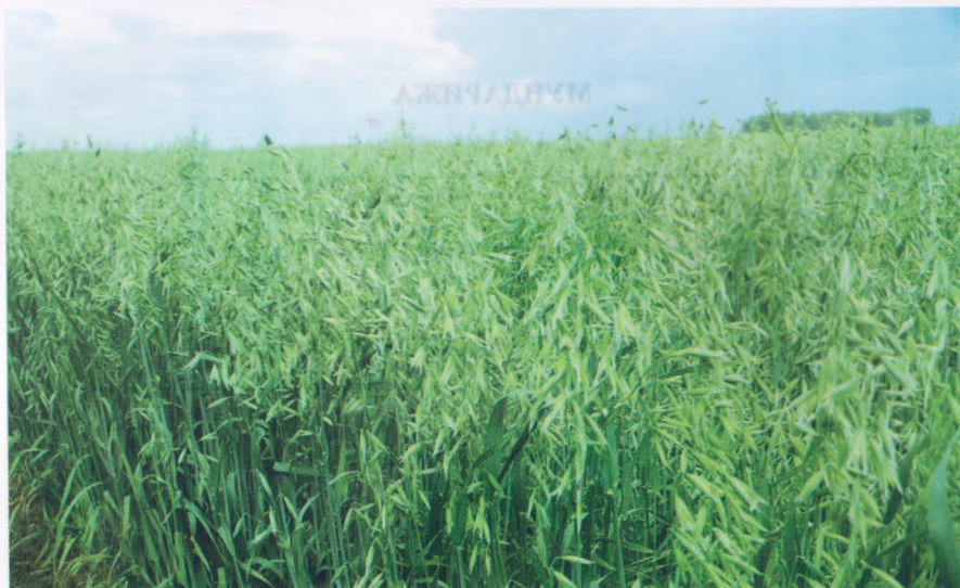
4-расм. Оралиқ экинлар экилган дала

Ўзги оралиқ экинлар шудгордан олдин солинган ўғитлар суперфосфат ёки аммофосдан ташқари аммиак селитраси гектарига 60 кг метёрда озиклантирилади. Кузги экинлар ҳам баҳорда худди шу метёрда озиклантирилиб, 2-3 марта суғорилади.