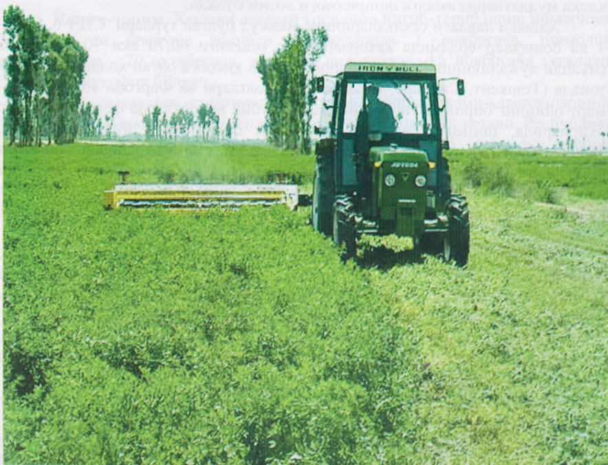
1-расм. Бедани пичан учун ўриш

Пичанлар йиғиштирилиб олингач, бедапояга ўғит селгич машиналар ёрдамида азотли ўғитлар(гектарига 30 кг меъёрда) сепилади ва икки кундан кейин суғорилади. Агар бедазор сезиларли даражада қияликлардан иборат бўлса, навбатдаги ўрим бошланишида 5-7 кун олдин яна бир маротаба суғорилади. Беданинг иккинчи, учинчи, тўртинчи ва бешинчи ўримлари ҳам худди шу тартибда ўтказилади. Ҳар бир ҳолда қанча ўрим йиғим техникаси ва транспорт воситалари керак бўлиши ва аслида уларнинг борлари қанча эканлиги назарда тутилган ҳолда иш кўрилади. Зарур бўлиб қолган тақдирда эса иш икки сменада ташкил этилади.