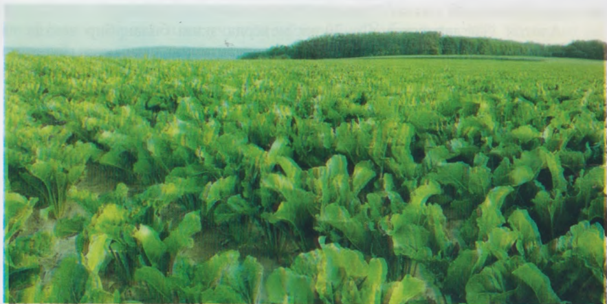
2-расм. Ҳашаки лавлаги илдизмева учун экилган дала

Йиғим-терим. Ҳашаки лавлаги ҳосилини йиғиб-териб олиш ишларини, Тошкент ва Фарғона водийси вилоятларида 1 ноябрғача, шимолий вилоятларда - 20 октябрғача, жанубий вилоятларда-15 ноябрғача тугаллаш мақсадга мувофиқ бўлади.