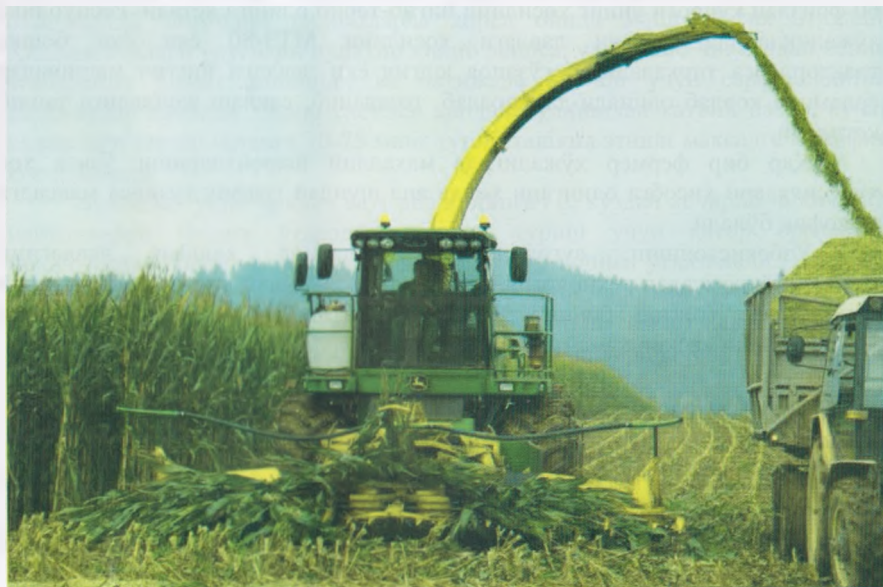
3-расм. Маккажўхорини силос учун ўриш

Кўк озуқага бўлган эҳтиёжга қараб экин майдонларини ҳамда чорва молларини оқ жўхори билан озиклантиришнинг давомийлигини режалантириш лозим бўлади.