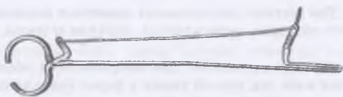
Рис. 22. Щипцы для ловли и фиксации песца и лисы за шею.

Пойманному и надежно удерживаемому в руках человека зверю фиксируют рот мягкой марлевой повязкой, которую накладывают вокруг челюстей и завязывают на спинке носа. У соболей и норок, лицевая часть которых более короткая и коническая, такую тесьму укрепляют предварительно вложенной поперек рта за клыками круглой гладкой палочкой; зажатая между челюстями палочка удерживается верхними и нижними клыками и одновременно сама фиксирует наложенную сзади нее тесьму.