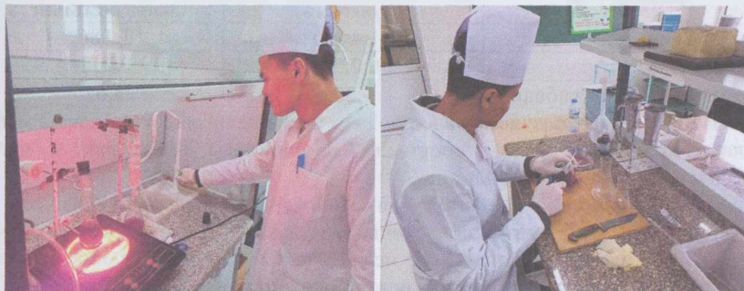
Рисунок 1. Процесс определения химического состава мяса.

В мясе кроликов, получавших пробиотик «Innoprovet», было установлено, что содержание белка в среднем на 2,57 % выше по сравнению с контрольной группой, содержание жира – на 0,09 % выше, зола – на 0,2 % выше, а влажность уменьшилась на 1,1 %.