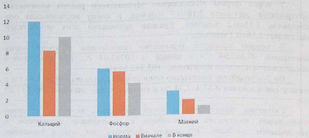
Рисунок 1. Уровень кальция, фосфора и магния в сыворотке крови коров.

Общий кальций в сыворотке крови фермерском хозяйстве «Сейт шаруа» в среднем составил 10,05 \pm 0,01 мг%, а в конце 8,32 \pm 0,01 мг%.