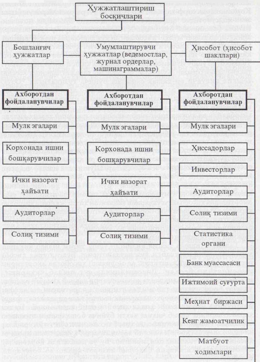
1-чизма. Ҳисоб маълумотларидан фойдаланувчилар