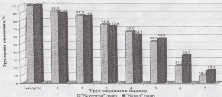
1-расм. Маржумак навлари уруғларининг унувчанлигига сақлаш муддатларининг таъсири.

Уруғларнинг сақланиш муддати икки йилдан ошгандан сунг уларнинг унувчанлиги пасая боради. Ишлаб чиқариш шароитида маржумак етиштириш учун уруғларининг пишиб етилишидан бошлаб то икки йилгача сақланган уруғлардан фойдаланиш максалда мувофиқ деб ҳисоблаймиз.