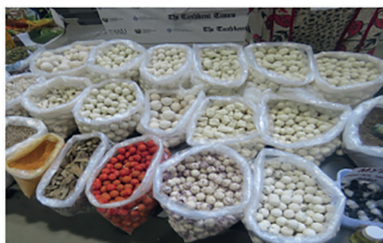
Маҳаллий қурт турлари