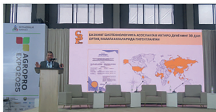
Фан янгиликлари тақдими