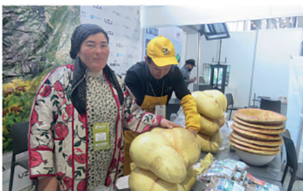
Зомин nonлари ва ота-боболар усулида мешқоба сақланаётган сариёғлар, зирavor ўсимликлар